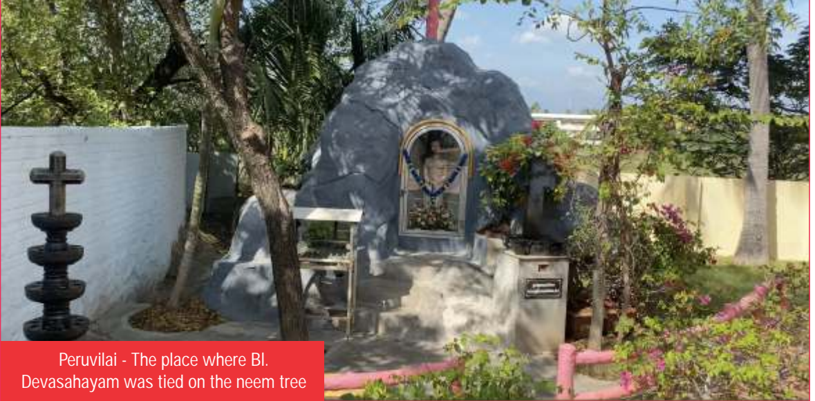
Peruvilai - The place where Bl. Devasahayam was tied on the neem tree