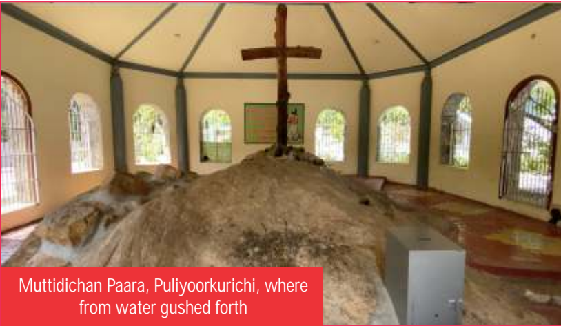
Muttidichan Paara, Puliyoorkurichi, where from water gushed forth

Devasahayam was brought to the executioner's house in Peruvila and was bound to a dead neem tree. Instantaneously, tender leaves sprouted on the dead tree. The executioner was flabbergasted at this and he understood the divine spirit that dwelt within Devasahayam.