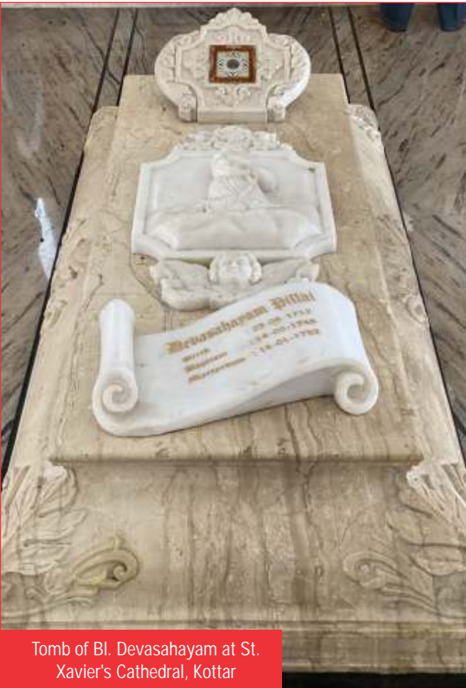
Tomb of Bl. Devasahayam at St. Xavier's Cathedral, Kottar