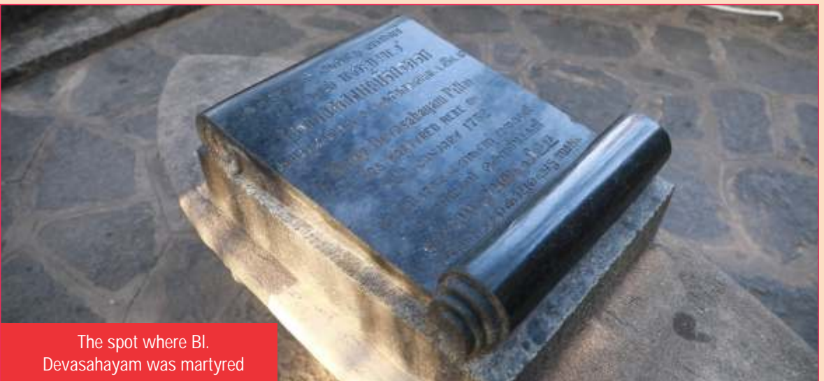
The spot where Bl. Devasahayam was martyred

Devasahayam was arrested and paraded across the country. For three years, he was subjected to humiliations and inhuman persecutions such as striking the soles of his feet with canes, thrashing him in the hot burning sun, rubbing chillies on the wounds, suffocating him with the smoke of burning chillies, and so on. These persecutions were meant to be a warning for those who desired Christianity. The historical fact is that the Christian faith flourished at whichever place Devasahayam was taken to and persecuted.