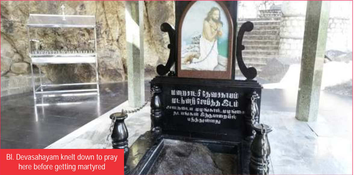
Bl. Devasahayam knelt down to pray here before getting martyred