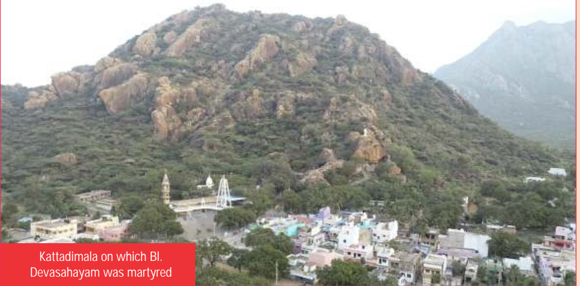
Kattadimala on which Bl. Devasahayam was martyred

gaining ground there. Members of the royal family and other community leaders stood united in rallying against him.