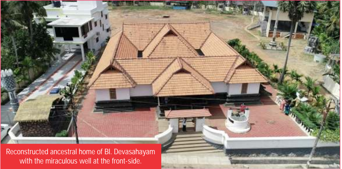
Reconstructed ancestral home of Bl. Devasahayam with the miraculous well at the front-side.