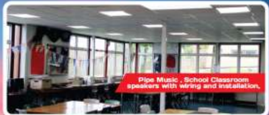
Pipe Music , School Classroom speakers with wiring and installation.