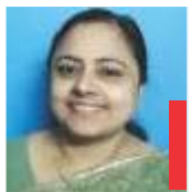
Mini Joseph Belongs to Little Flower Forane Church, Nerul

ഈ നോമ്പുകാലം കാര്യം പൂക്കുന്ന വസന്തമാകട്ടെ! ആശംസകളും പ്രാർത്ഥനകളും.