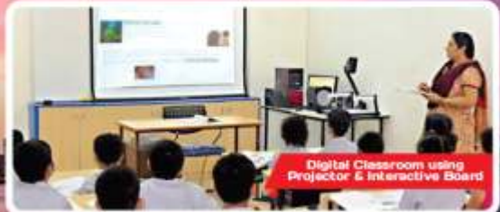
Digital Classroom using Projector & Interactive Board

Vile Parle : B5-6, Kamdar Shopping Center, Backside Basement, Opp. Rly. Station, Vile Parle (E), Mumbai: 400057.