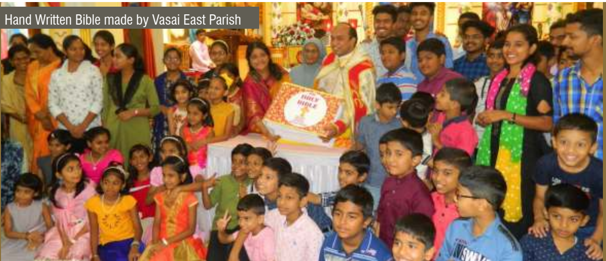
Hand Written Bible made by Vasai East Parish

For more details contact the Diocesan Youth Executives of your respective foranes.