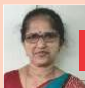
Translated by Dr. Valsamma Wilson of Bhandup Parish

So what shall we do? We shall ask God's consent before doing anything. Ask Him what shall I do, where should I go, or what is your wish? From that very moment we will be under the control of Holy Spirit. He will fill us with the chosen Graces so that we will be a blessing for many. He will allow certain sufferings in our life situations to transform us to be a blessing to many. Thus those permitted sufferings will be the key to the required abilities and Graces.