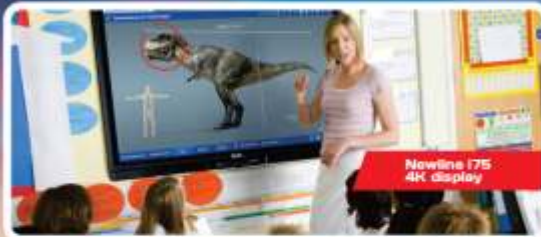
Nowline I75 4K display